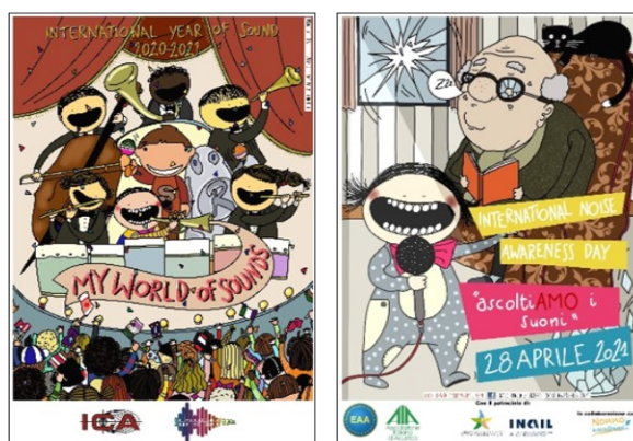
Figura 1 – Locandine dell'IYS 2020-2021 e della giornata INAD-Italia 2021

Tutti i contributi italiani, compresi i video musicali realizzati dagli studenti delle scuole secondarie sulle note della loro strofa e del ritornello, insieme a quelli delle altre scuole del mondo, saranno montati in un film e in varie videoclip pubblicate su YouTube e sui vari social networks, a fini di promuovere l'iniziativa a livello mondiale.