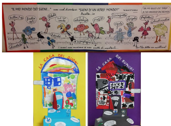
Figura 2 – Elaborati grafici prodotti durante il concorso “AscoltiAMO i suoni”

Il gruppo INAD-Italia ha promosso il concorso a premi e le attività dell'IYS 2020-2021 tramite contatti diretti con le scuole, raccolti nelle precedenti edizioni di INAD-Italia, contatti con altri Enti che si occupano della diffusione della tematica del suono come l'Associazione “Nonno Ascoltami”, il gruppo FKL Italia “Forum per il paesaggio sonoro” e la Regione Toscana, promotrice dell'attività “La scuola toscana fra i suoni 2020-2021”.